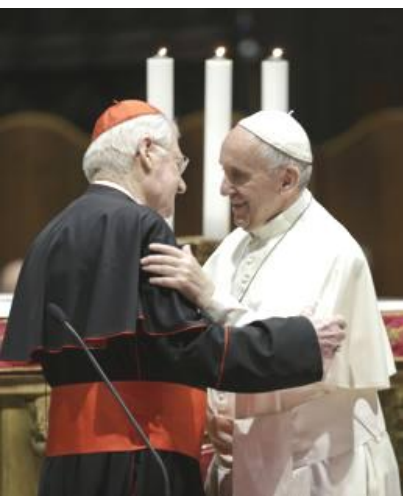
Papa Francesco, omelia Messa a Monza, 25 marzo 2017

Si specula sui poveri e sui migranti; si specula sui giovani e sul loro futuro. Se continuano ad essere possibili la gioia e la speranza cristiana non possiamo, non vogliamo rimanere davanti a tante situazioni dolorose come meri spettatori che guardano il cielo aspettando che "smetta di piovere". Tutto ciò che accade esige da noi che guardiamo al presente con audacia, con l'audacia di chi sa che la gioia della salvezza prende forma nella vita quotidiana della casa di una giovane di Nazareth.