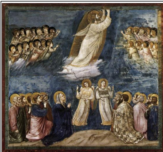
CAPPELLA DEGLI SCROVEGNI